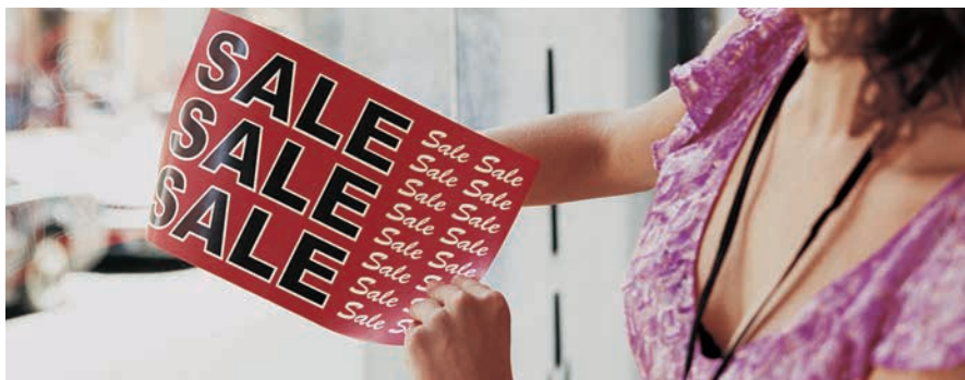
Sinalética para Janelas Xerox® NeverTear

O nosso Toner especial EA de fusão a baixa temperatura especial para poliéster, realiza a fusão em poliéster usando um método químico de fusão proprietário que assegura uma superior qualidade de imagem em substratos especiais incluindo poliéster e outros. O nosso Toner EA, incluindo Premium NeverTear é resistente a água, óleo, gordura e rasgões.